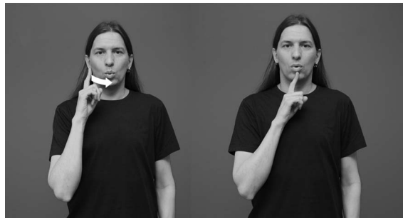
Kuvasarja 1. Viittoma KUURO 1 .

Kuten edeltä on käynyt ilmi, viittomakielisten kieli- ja kulttuurivähemmistöä on kuvattu monin erilaisin nimityksin eri aikakausina. Kullakin kieli- ja kulttuurivähemmistöllä on tarve ja oikeus itse määrittellä, keitä he ovat. Suomessa yhteisö käytti itsestään alkuun nimitystä kuuromykät (ruots. dövstum , engl. deaf mute ), ja 1900-luvun puolivälin tienoilla nimitys lyheni kuuroiksi (ruots. döv , engl. deaf ). Suomalaisella ja suomenruotsalaisella viittomakielellä viittomakieliset ovat viittaneet itseensä ja oman ryhmänsä jäseniin viittomalla KUURO 1 (kuvasarja 1).