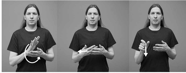
Kuvasarja 3. Suomalaisen viittomakielen viittoma VIITTOMAKIELINEN.

Luukkaisen väitöskirjatutkimuksessa haastatellut 18 henkilöä jakaantuivat kolmeen eri ryhmään sen mukaan, miten he kokivat samastuvansa termeihin kuuro ja viittomakielinen : osa koki olevansa voimakkaammin kuuroja kuin viittomakielisiä, toiset päinvastoin, kolmas ryhmä taas ajatteli olevansa toisinaan kuuro ja toisinaan viittomakielinen. Termi viittomakielinen herätti haastatelluissa hie-man hämmennystä. Sitä esimerkiksi pidettiin liian laaja-alaisena – eräs haastateltava perusteli tällaista näkemystään ilmaisulla ”koska kuulevakin voi olla viittomakielinen”. 20