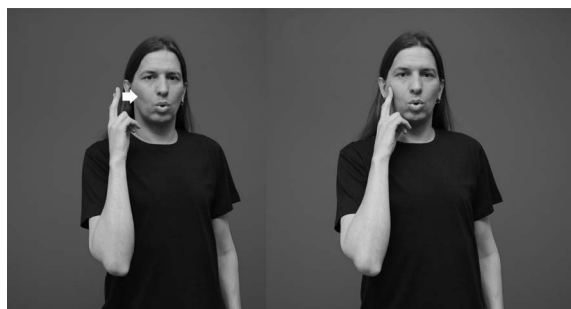
Kuvasarja 2. Viittoma KUURO 2 .

kuuroa, joka kuuluu viittomakieliseen yhteisöön ja on omaksunut yhteisön kulttuurin ja identiteetin. 19 Tämä vahvistaa ajatusta siitä, että viittomakielisille itselleen keskeisin kuurojen yhteisön jäseniä yhdistävä ominaisuus on viittomakieli eikä kuulon puuttuminen. Englanninkielisessä kirjallisuudessa sama merkitys ilmaistaan kirjoittamalla sana Deaf isolla alkukirjaimella. Suomen ja ruotsin kielellä samaa erottelua ei voi ilmaista alkukirjaimen koolla, koska alkukirjainta koskevat oikeinkirjoitussäännöt ovat erilaiset kuin englannissa: muitakaan ryhmän jäsenyyteen viittaavia sanoja ei suomessa ja ruotsissa kirjoiteta isolla alkukirjaimella. Suomessa käytetään myös KUURO 2 -viittomaa (kuvasarja 2).